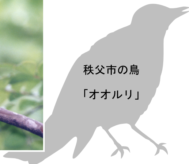
秩父市の鳥 「オオルリ」