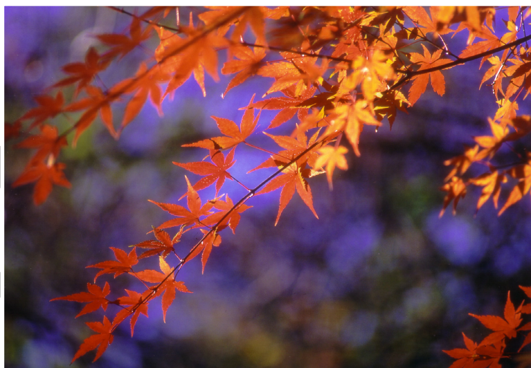
秩父市の木 「カエデ」