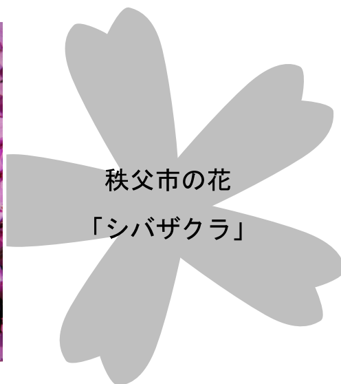
秩父市の花 「シバザクラ」