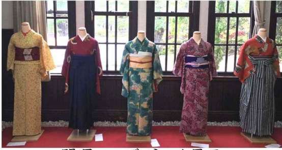
開運コーディネート展示

4月、芝桜が咲き誇るころちちぶ銘仙館では春の銘仙館まつりを行います。着物の回廊(虫干し)をはじめ様々なイベントを行いゴールデンウィーク中は沢山の方にお越しいただきました。今年は「開運コーディネート展示」のお手伝いをさせて頂きましたので少しだけご紹介します。