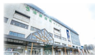
秩父市地場産業振興センター

地域内の約150の企業が参加する企業グループ。多様なテーマを研究する分科会活動を通じて企業間連携、産学官連携を促進させ、企業成長の基盤となっています。