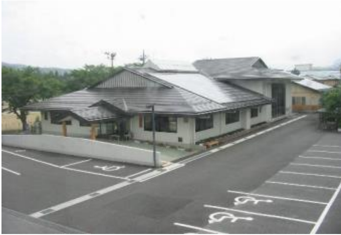
棟 情 報