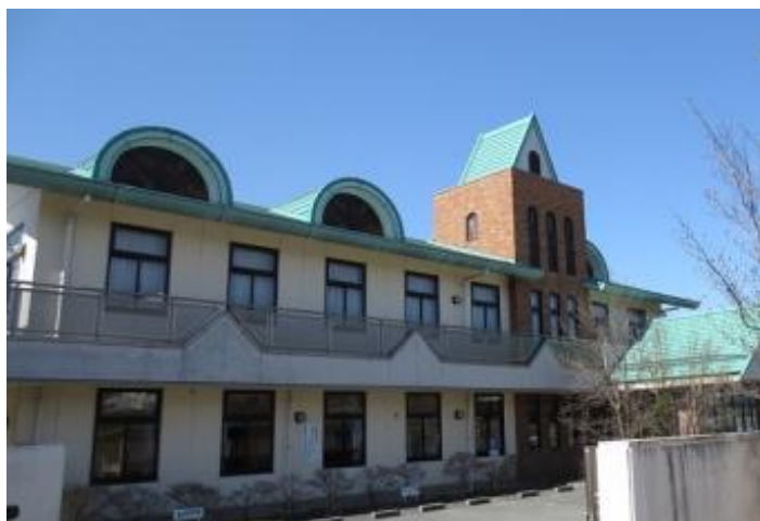
棟 情 報