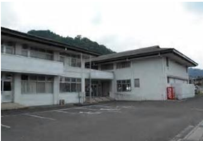
棟 情 報