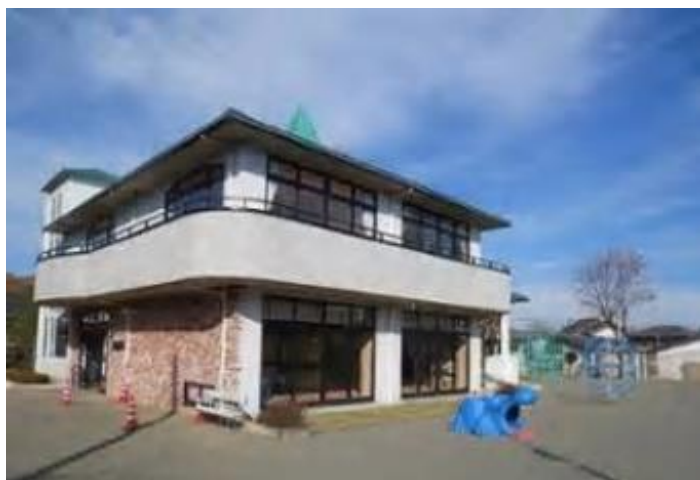
棟 情 報