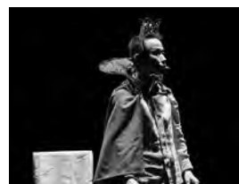
『はだかの王様』初演