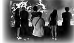
遠足(すみだ水族館)

教職員と保護者が協力し、卒業生の会や地元企業など、多くの方に支援をいただきながら、本年度もさまざまなことにチャレンジしていきます。ぜひ、ホームページで生徒の活躍をご覧ください。