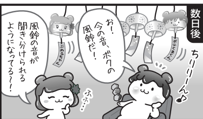
みんなも自分だけの夏の楽しみを見つけてみてね