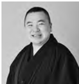
とうげつあん くるま 桃月庵 黒酒