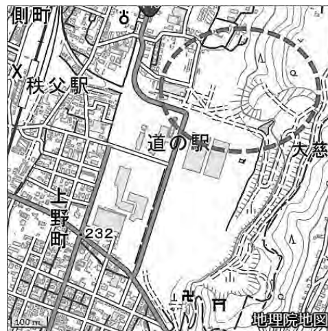
最有力建設候補地の位置 (おおむねの範囲)

※旧秩父セメント第一工場跡地は都市計画法に基づく用途地域「工業地域」として指定されており、現状では病院を建設することはできません。今後、周辺一帯のまちづくり構想を策定し、病院が建設可能となる用途地域への変更手続きが進められることを前提としています。