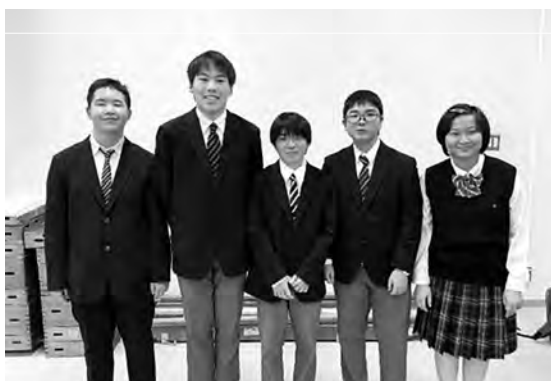
◎今年度から秩父特別支援学校高等部が加わり、各校の取り組みを紹介します。