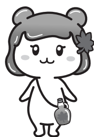
秩父市イメージキャラクター ぷめるちゃん