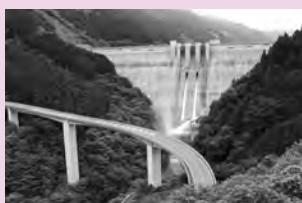
滝沢ダム (大滝地区)