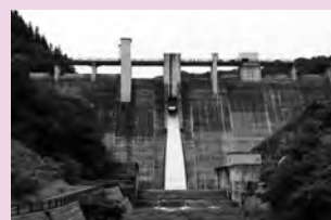
かつかく 合角ダム (吉田地区)