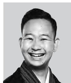
さんゆうてい じょう 三遊亭ふう丈