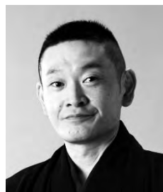
しん き ろうりゅうぎよく 蜷気楼龍玉