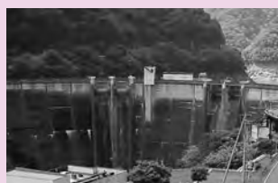
二瀬ダム (大滝地区)