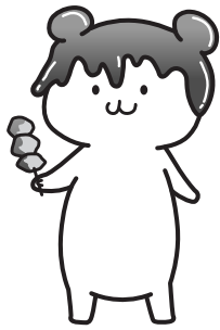
秩父市イメージキャラクター ポテくまくん