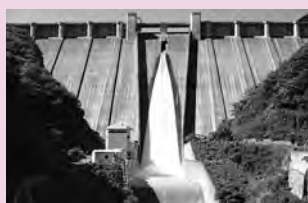
浦山ダム (荒川地区)