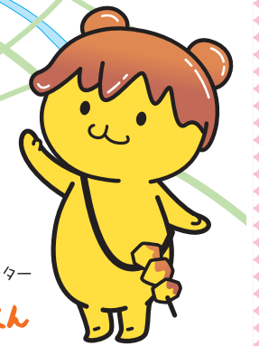
秩父市イメージキャラクター ポテくまもん