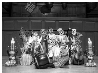
ズーラシアンブラス・弦うさぎ・クラリキヤット・ドール