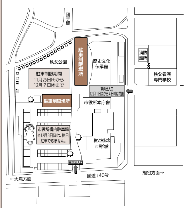
秩父夜祭に伴う市役所構内駐車場【案内図】