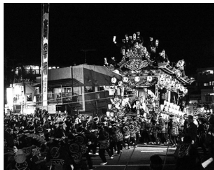
迫力満点の団子坂の曳き上げ！ 3日の夜にクライマックスを迎えます。 ※流鏝馬は今年実施されません。