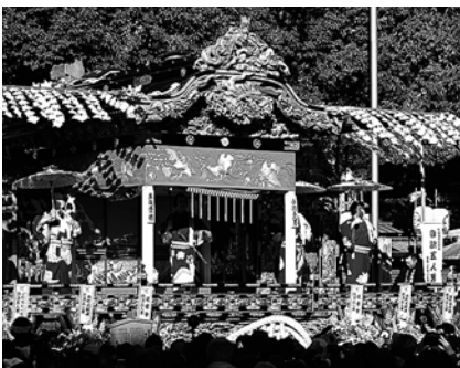
屋台芝居は本町が当番町！ 3日午後1時ごろから秩父神社境内で