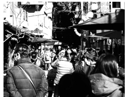
黒門通り周辺では今年も絹市も開催！ 12月2・3両日とも楽しめます。