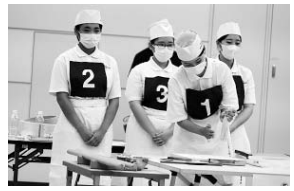
【全国高校生そば打ち選手権大会の様子】

また、食品化学科の生徒が、8月2日(水)、「第13回全国高校生そば打ち選手権大会」に出場しました。本校は、上位進出を目指す強豪校ですので、全国第4位も生徒たちには悔しい結果でした。来年度「全国制覇」を目指します。