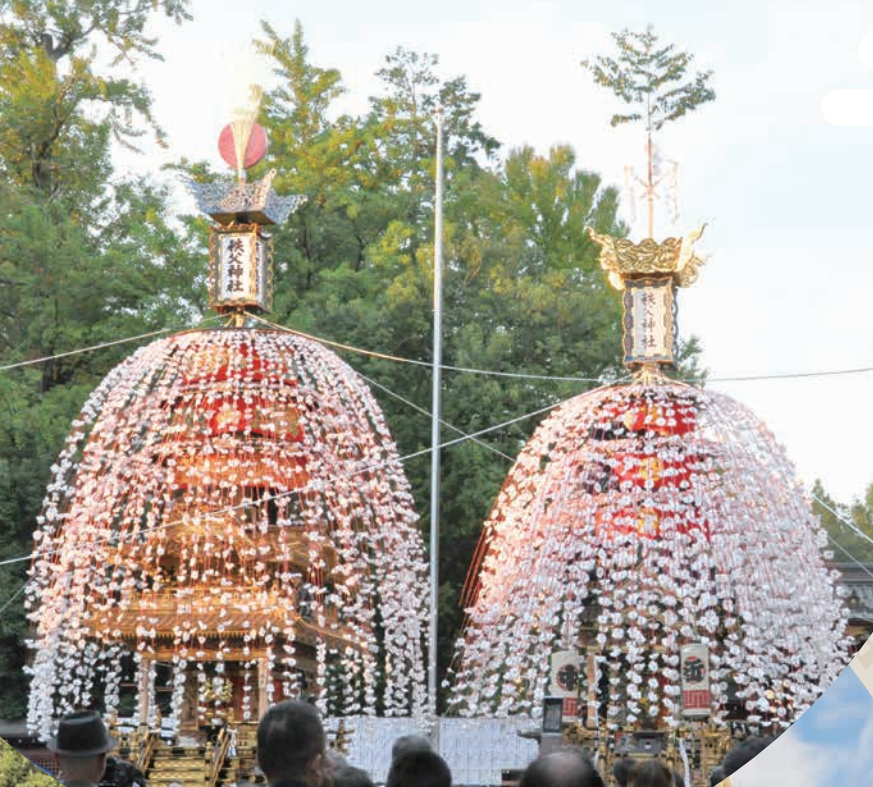
秩父祭 / 笠鉾・屋台