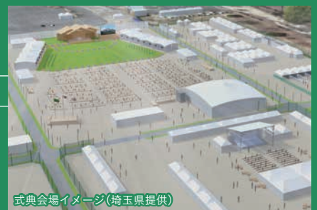
式典会場イメージ