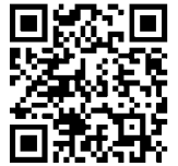
秩父市行政組織図