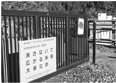
標語入り看板の設置

しかし、市外からの自殺死亡率が他県と比べて継続して高いことから、鉄道、ダム管理所など、自殺率の高い場所に関係する機関が連携し、市外の方へ向けた自殺対策に取り組んでいます。