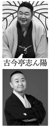
古今 亭 志ん 陽