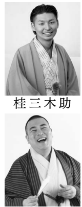
桂 三木 助