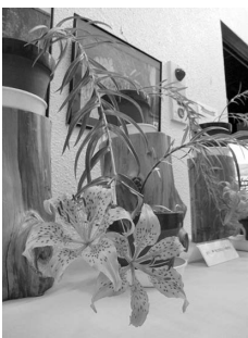
絶滅危惧種 ミヤマスカシユリ