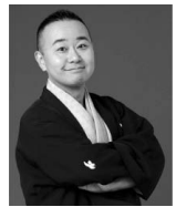
桂 やま と

料金 全席自由 【各回】1,000円 【第13～15回通し券】2,500円 ※未就学児の入場不可 発売日 6月20日(日)午前10時から