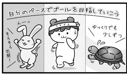
ポテくまくんはみんなを応援しているよ