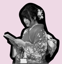
▲令和2年成人式の様子