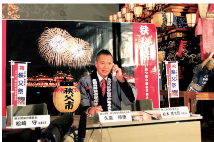
午前2時2分(日本時間)に登録が決定し、その後文化庁から連絡が入る