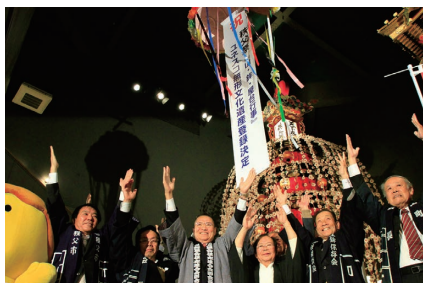
お祝いのくす玉割り