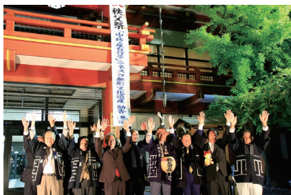
秩父神社平成殿の前に勧告決定の懸垂幕を掲示