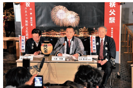
臨時記者会見で市長が喜びのコメントを読み上げる