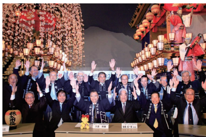
勧告直後の臨時記者会見で、祭り関係者が歓喜に沸く