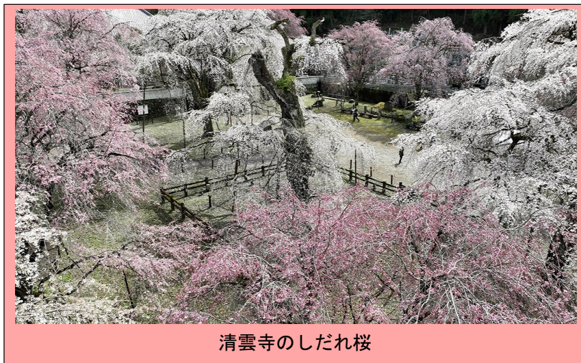
清雲寺のしだれ桜