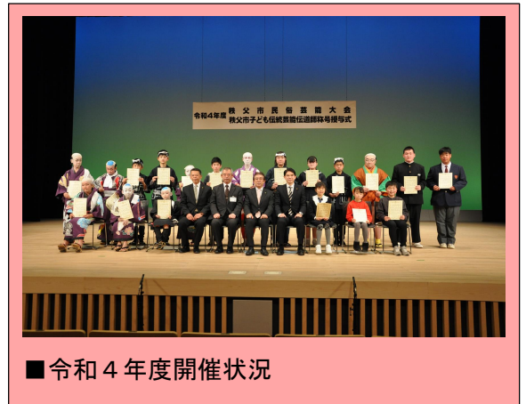
■令和4年度開催状況

また、午後には秩父歌舞伎正和会の皆さんの定期公演がございます。迫力のある一幕をお楽しみください。