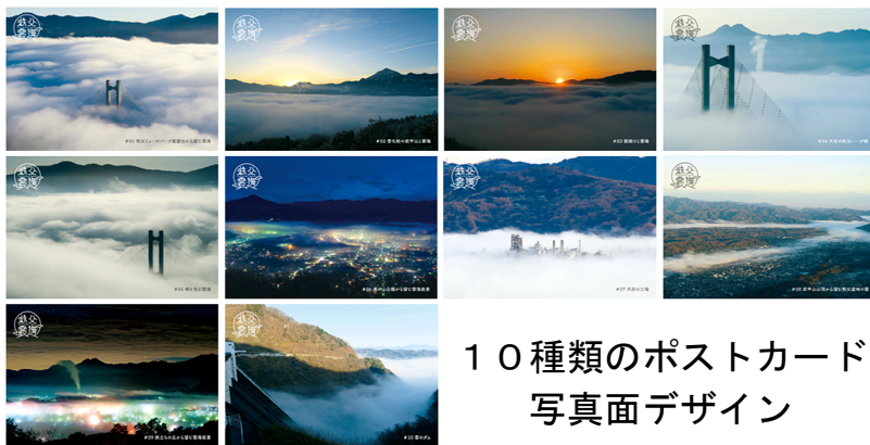
10種類のポストカード 写真面デザイン

全10種類のポストカードは、お1人あたり1種類につき1点限りとして無料配布し、なくなり次第、配布は終了となります。