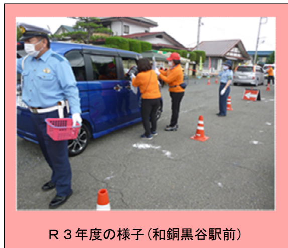
R3年度の様子(和銅黒谷駅前)

夏の行楽シーズンを迎える当市は、市民はもとより、観光客など当市を訪れるドライバーの方々へ、交通事故防止を呼び掛けるために、ナスと除菌ウェットティッシュ等の啓発品を配布し、夏の交通事故防止運動に先駆け、「おしぼり作戦」として実施します。