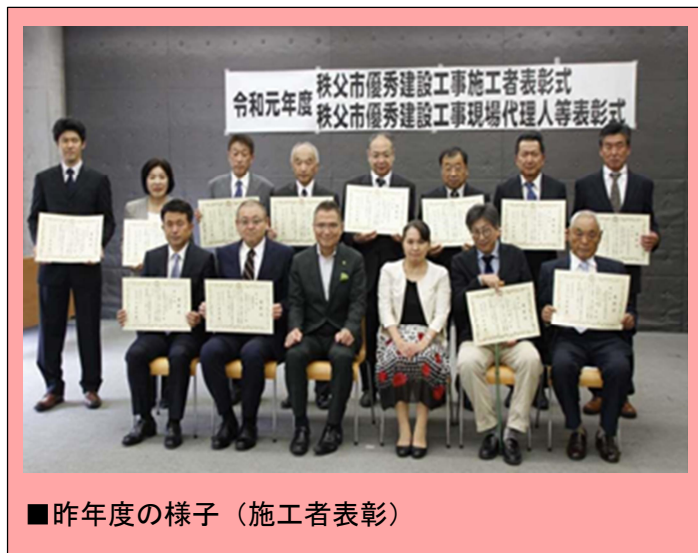
■昨年度の様子（施工者表彰）

令和元年度に完成した工事のうち58件を対象に審査委員会が厳正な審査を行い、施工者11社、現場代理人7人の被表彰者を選定しました。