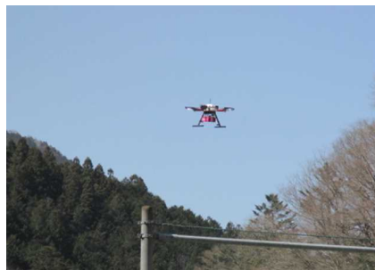
ドローンが荷物を運んでいる様子