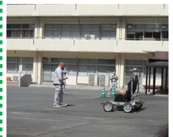
AI搭載車が荷物を積んで人の後ろをついて走行している様子

☆ 以上のような課題に直面する時に、未来技術を使ってすぐに対応できる取り組みを、作っておかなければならないということ。それがSociety5.0による新たな社会の構築です。大滝地域は、これから西関東連絡道路・大滝トンネルの建設などで大きく変わろうとしています。大滝の素晴らしい自然と良いところを残しつつ新しい技術と共存して元気に過ごしましょう。