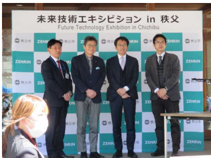
左からアズコムデータセキュリティ、秩父市長、ゼンリン、早稲田大学