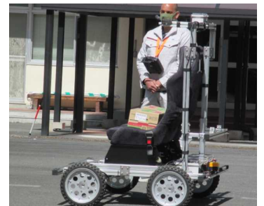
AI搭載車で荷物の運搬