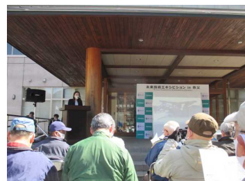
熱心に聞き入る地域の方々