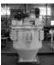
自社開発の混合(機)のOMK(OMK)企業理念と

当社は、昭和45年に(株)ニッチツ秩父鋳業所から工作課を母体として分離独立しました。主な業務は一般産業機器、鉄構造物等の製作および機器保全、天然ゴムの加工です。特に天然ゴムは、マレーシアのライナテックス・ラバープロダク