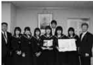
受賞の報告に市長を訪れた 秩父第二中学校合唱部の皆さん

秩父ファミリー・サポート・センター (社団法人 秩父市シルバー人材センター内) ☎ 21-3311 (直通)