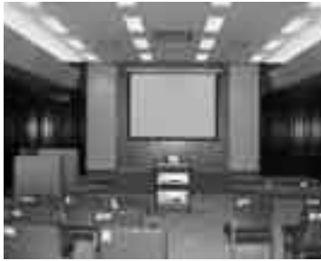
荒川総合支所多目的ホール熊倉

市では、合併に伴い利用しなくなった各総合支所の議場や委員会室について、その一部を多目的ホール・会議室として市民の皆さんに開放することになりました。