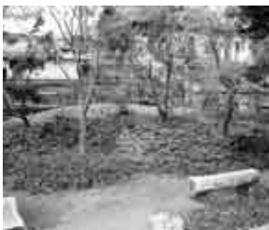
秩父の自然の森をイメージしています (旧秩父消防署跡地)