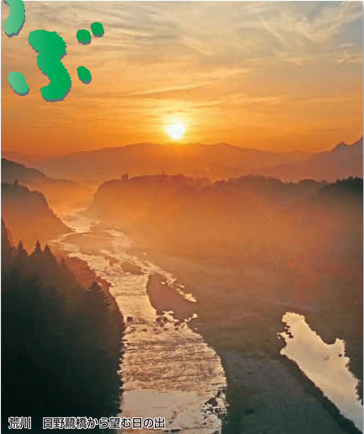
荒川 目野鷺橋から望む日の出

[世帯数] 26,138世帯 前月比+27世帯 平成17年12月1日現在 (人口・世帯数は 外国人登録を含む)