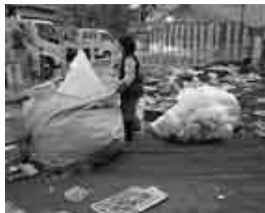
みなさんのご協力をお願いします

12月2日、3日に行われる秩父夜祭では、例年排出されるごみは約30トンにもなります。夜祭ごみは、道路や公園などに多量に散乱し、市では業者に委託して処理をしています。しかし、ごみの分別作業に人手が不足し、夜祭ごみの対応に苦慮しています。