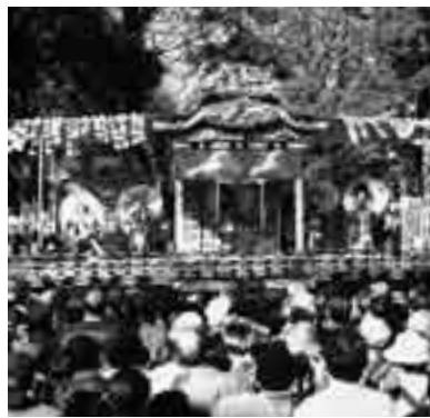
昨年の「屋台芝居」風景

街のあちこちから屋台囃子の太鼓の音が聞こえてくる季節となり、秩父の一大行事「秩父夜祭」まで、あと1か月足らずとなりました。今年も、3日が土曜日ということで、例年以上の観光客数が予想されます。このため、広範囲に交通規制が実施されますので、市民の皆様のご理解とご協力をお願いします。