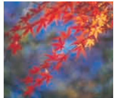
秩父市の木「カエデ」