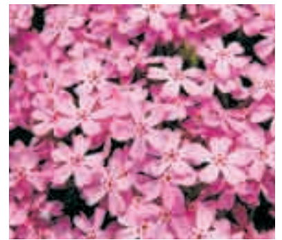
秩父市の花「シバザクラ」