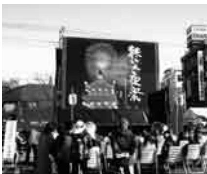
オーロラビジョンの迫力ある映像をお楽しみください