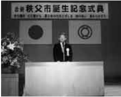
式典であいさつをする栗原市長

10月20日、合併秩父市誕生記念式典が、市民会館ホールで行われ、約1,100人が参列しました。式典の席で、総務大臣から、栗原稔旧秩父市長、猪野正一旧吉田町長、山口民弥旧大滝村長、宮崎哲夫旧荒川村長に合併功労特別表彰が授与されました。