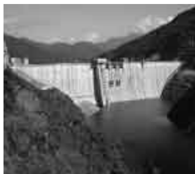
試験湛水が始まった滝沢ダム

これと並行して、関連する市道や周辺整備等の工事を行い、平成20年4月からダムの本格運用が開始される予定です。