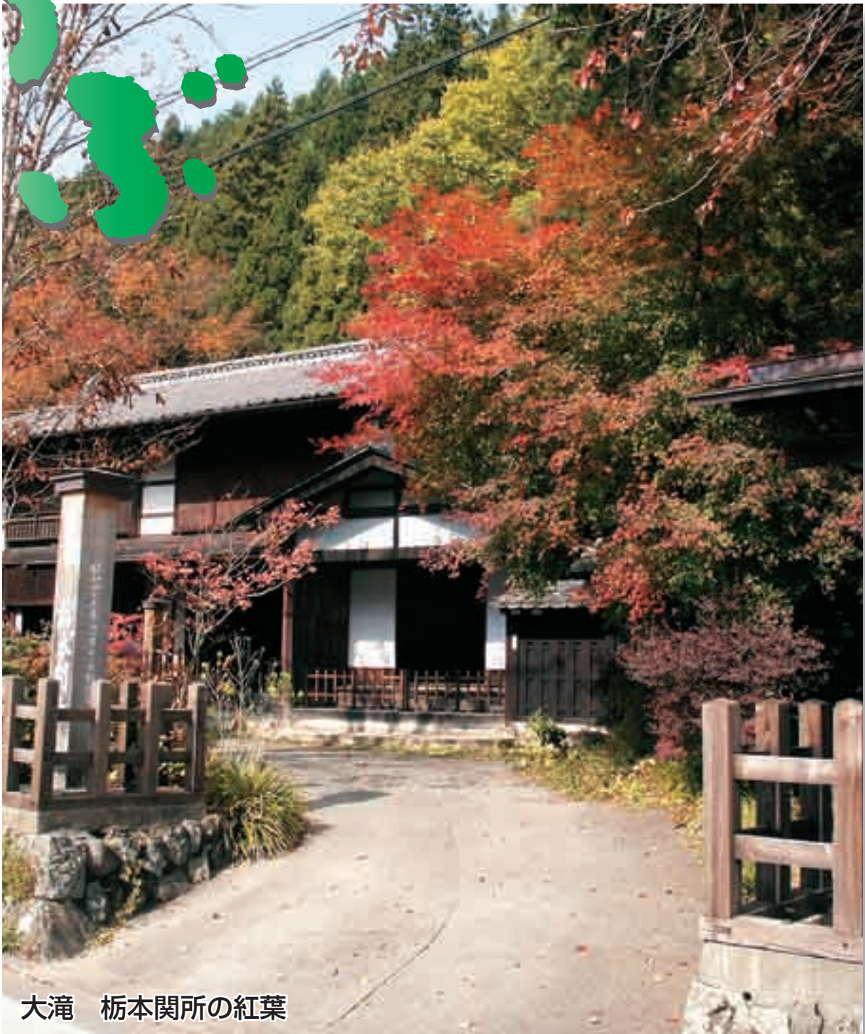
大滝 栃本関所の紅葉

【世帯数】 26,105世帯 前月比-24世帯 平成17年10月1日現在 (人口・世帯数は 外国人登録を含む)