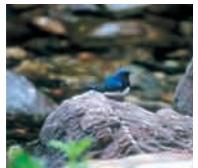
秩父市の鳥「オオルリ」