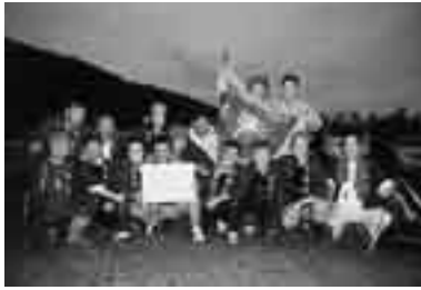
優勝した上蹴翔舞流の皆さん

なお、今年も各流派の打ち上げ技術を競う「龍勢打上げコンクール」が実施され、次の3流派が栄光を勝ち取りました。