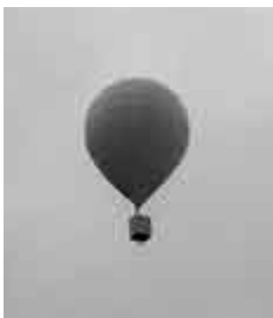
みんなのメッセージを載せたバルーンは空高く舞い上がりました

この全員集合で、秩父市の未来を担う児童生徒が、元気に学校生活を送り、自分の将来の夢の実現に向かって学習や運動に精一杯がんばろうとする気持ちが大きくふくらんだことでしょう。