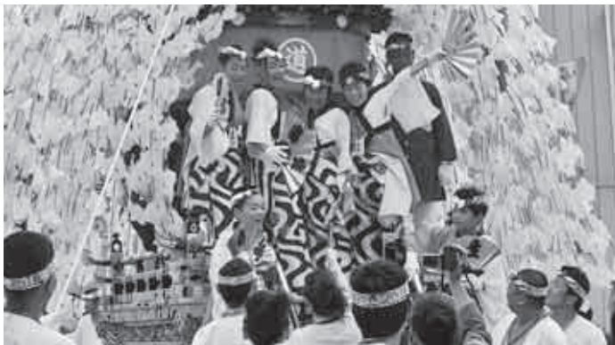
子どもたちの一生の思い出

の中で、奨学金増額等の支援策は。 答 秩父市の奨学金は、基金を運用した無利息の貸付制度で3種類ある。現在滞納は15件396万2千円である。滞納者には償還計画の相談等を行い滞納対策に努めている。