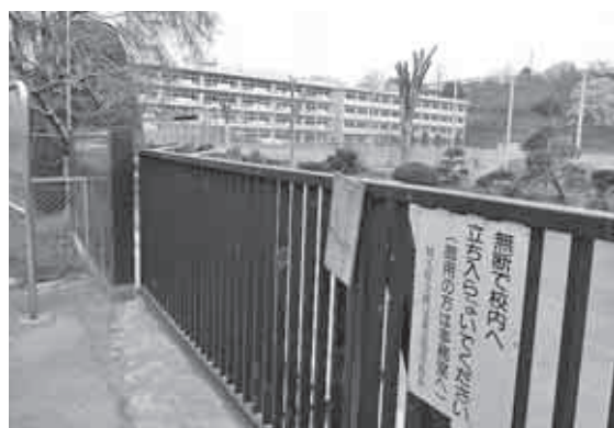
旧秩父東高等学校

答 現在採掘が行われている中、採掘をしている3社と連絡を密に研究をしていきたい。