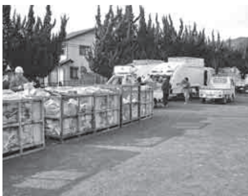
中村町育成会で行っている廃品回収

答 道路交通法上、自動車賠償責任保険が適用されるので、この子ども賠償責任保険の対象外。自動車に関係する事故では、補償額が高額になるケースもあるので、保険の内容について事前に確認するよう今後、各育成会の指導者の方々への啓発を積極的に行う考えである。