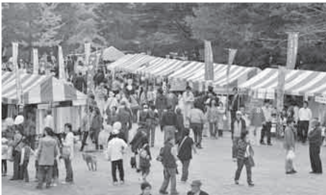
秩父はんじょう博の様子

答 3つということ、「産学官連携コーディネート事業」「産学官連携推進事業資金貸付制度」「FIND-CHICHIIBU支援事業」がある。コーディネーターの活動日数を増やし、事業の拡充を図っている。