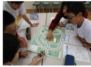
プログラミング学習