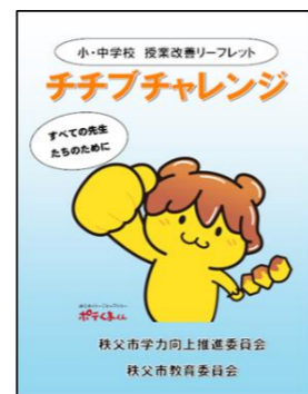
学力向上リーフレット チチブチャレンジ