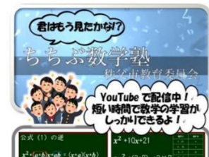
オンデマンド型の活用