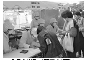
食品化学科「販売の行列」