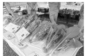
農業科の新鮮野菜

来年も、趣向を凝らして開催します。秩父夜祭に負けない、もう一つの祭「秩農工祭」にご期待ください。