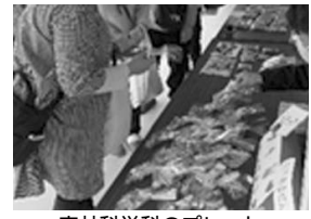
森林科学科のプレート