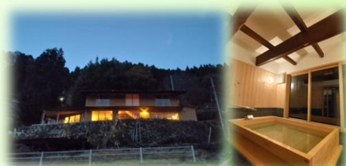
● 共同浴場 湯屋「月」(2023年)