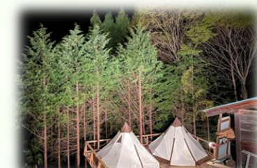
● 仮称キャンプ場「森と空」(2024年)