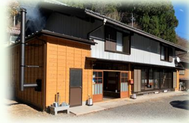
● 栃本旅籠「空」一棟貸し 素泊り 5万円/4名まで+5000円/1名追加