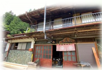
● 民泊「甲武信」 素泊り 大人6000円・夕朝食5000円