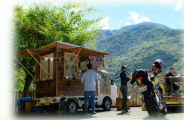
● カフェもくもく 飲物&軽食キッチンカー