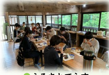
● ふるさとてらす 食事処&イベント会場