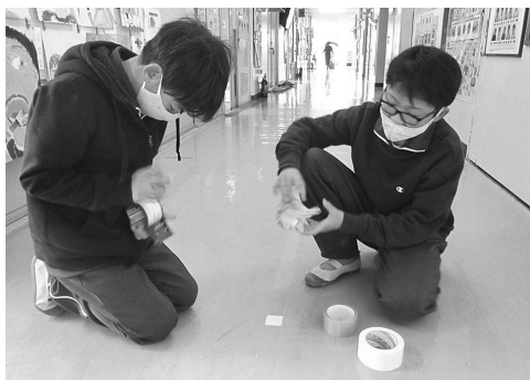
南小／ソーシャルディスタンスマーク貼り付け