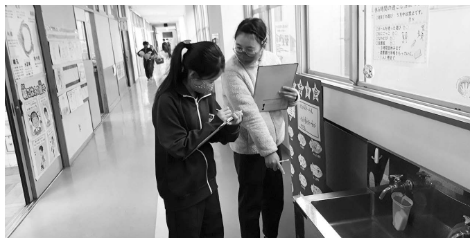
花の木小／校舎内の安全点検