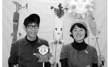
劇団にんぎょう畑