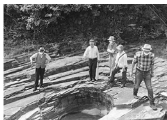
ジオツアーの様子

ジオサイトの視察やジオツアーに同行しながら、地質、地形のこと、さらに大地の成り立ちと深いつながりがあるさまざまな寺社をはじめ、秩父の歴史・文化についても勉強しています。