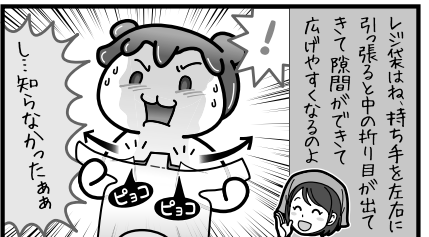
レジ袋がめくれなくてイライラ...が解決! みなさんもやってみてね