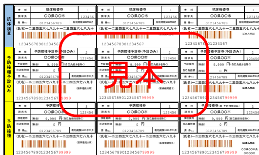
市区町村から送付されるクーポン券(イメージ)

※1年目は、昭和47年4月2日から昭和54年4月1日までの間に生まれた男性に対しクーポン券が送付されました。(Q6参照)