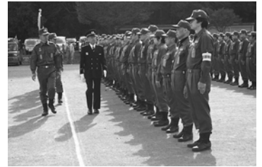
部隊点検：点検者が消防団員の姿勢、服装などを点検している様子

消防団特別点検は、点検者（秩父市長）により消防団員の職務遂行に必要な、服装規律、機械器具および消防操法訓練などが総合的に点検されます。