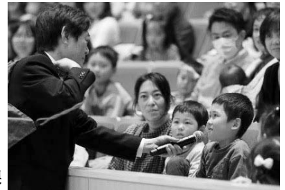
参加コーナーの様子

国道140号を避けたルートで影森を抜け、浦山歴史民俗資料館方面へ進みます。浦山川にかかる橋を渡り、清雲寺の横を通り上流を目指します。道なりに進むと国道に出るので、武州日野駅へ向かいます。ここでも国道を避けて道の駅あらかわに到着したら休憩です。