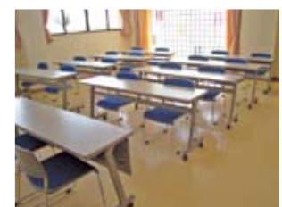
多目的ホール 小会議や学習室にもどうぞ。プロジェクターもお使いいただけます。