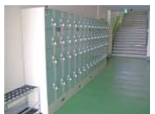
ロッカーホール 無料のコインロッカーです。