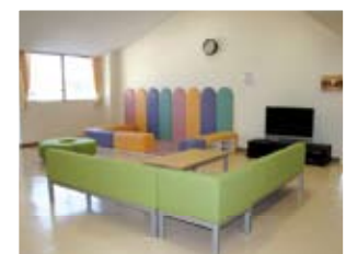
センターホール 遊び疲れたときの一休みにどうぞ！