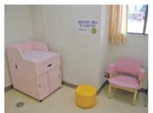
授乳室 赤ちゃん・お母さんも安心。お湯もご利用いただけます。