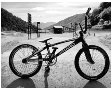
私、高山の使用するレース用BMXです！

BMXは、自分自身をコントロールして走り抜く高度な技術やバランス感覚、瞬時の駆け引きが要求され、操作による基礎体力・バランス感覚の向上や、フェアプレーとスポーツマンシップの精神が学べ、青少年の心身を発達させます。個人種目であることから自身のペースで乗ることができ、家族や友人と遊ぶなど競技だけではなく趣味としてもお楽しみいただけるのが魅力です。 BMXは、自転車が大好きなお子さんにとって、どこへでも連れて行ってくれる頼れる相棒になってくれるはず。そして、さまざまなサイクリングの入口となり、その先にあるオリンピック出場といった夢も広がります。秩父滝沢サイクリングパークは現在冬季閉鎖中となっておりますが、4月から営業が再開されますので、楽しみに待っていてください。