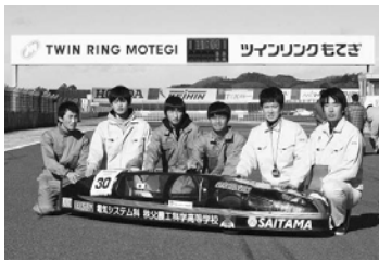
秩父農工科学高校の手作り電気自動車