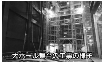
大ホール舞台の工事の様子

していきます。市民の皆さんも、この大ホールを存分に活用し、育ててほしいと思います。