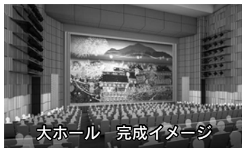
大ホール 完成イメージ