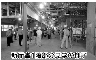
新庁舎1階部分見学の様子