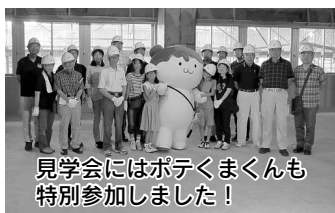
見学会にはポテくまくんも特別参加しました!