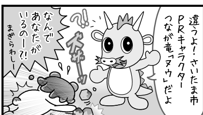
なんで又ウがいるの?! 答えは下を見てね!