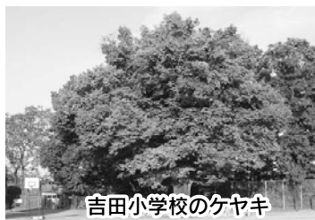
吉田小学校のケヤキ

●巨木の健康診断 10月1日(土)、2日(日)に開催される「第29回巨木を語ろう全国フォーラム埼玉・秩父大会」のプレイベントが開催されます。