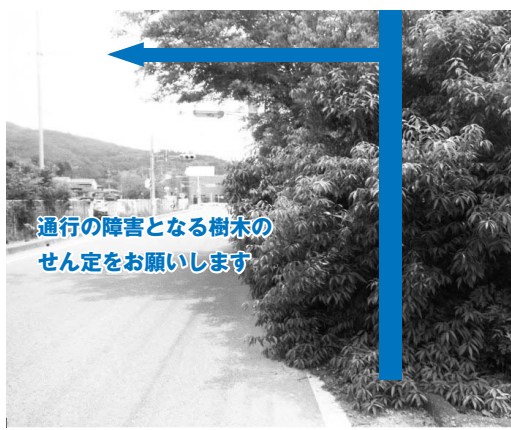
通行の障害となる樹木のせん定をお願いします

※緊急の場合は、道路通行の支障となる樹木や枝などを予告なく伐採・撤去することがあります。