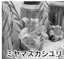
ミヤマスカシユリ

武甲山の貴重な植物の保護増殖に取り組む秩父太平洋セメント(株)のご協力で、開花期間に限り、「ムラサキ」「ミヤマスカシユリ」の展示を行います。ムラサキは万葉植物で、古来より根が染料