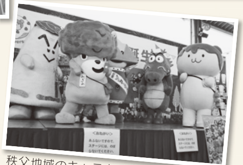
秩父地域のキャラクターもお祝いに駆けつけてくれました

とき 2月20日(土)午後7時 ★ウイスキー祭応援企画! 秩父大好きちよい呑みフェスティバル 翌日2月21日(日)に秩父神社で行われる秩父ウイスキー祭を応援するため、みやのかわ商店街では、ウイスキーや地酒、おいしい料理が楽しめるイベントを開催します!豪華景品が当たる抽選会もありますので、ぜひご参加ください。 ★福引大会 ★参加方法 ナイトバザールの福引会場へ市報のこのページをお持ちください。福引きに1回参加できます。(1人1枚まで)