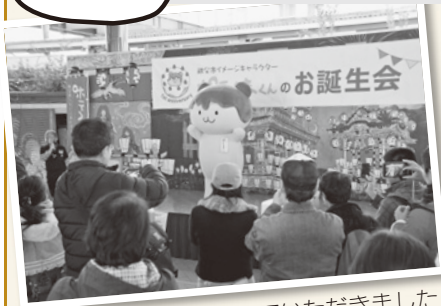
多くの皆さんに集まっていただきました

1月11日(月・祝)、西武秩父仲見世通りふるさと広場で午前・午後の2回行われました。ポテくまくんグッズやみそポテトも販売され、会場は大変盛り上がりしました。