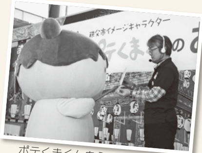
ポテくまくん自ら色紙にサイン!?

ポテくまくんの歌・「ポテくまマーチ」も発表され、作曲者の高橋浩美先生に歌と伴奏を披露していただきました