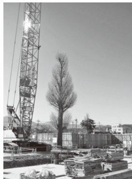
移植前のイチヨウ

保健センターでは、乳がん、子宮頸がん検診、健康相談等を実施しています。この機会にぜひ、自身の健康に関する知識や予防方法、検診について考えてみましょう。