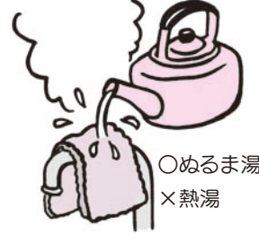
ぬるま湯 ○ 熱湯 ×

③ 水道が凍って出ないときは? 凍った水道管等に、タオルをかけて、その上からゆつくりとぬるま湯をかけて溶かす。熱湯は、絶対にかけない。(破裂等の原因となる)