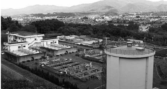
秩父市水道部事務所と別所浄水場

答 市内山林の生産材による有効活用など事業化されている。私にとって必要な海外視察は、今後も続けていく。