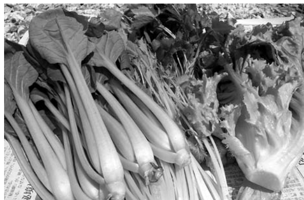
野菜工場で作ることができる様々な野菜

野菜工場」ユニットについては、市としてもこの技術と地域内外の企業とのマッチングができれば雇用の創出に有益と考え、機会をとらえて前向きに対応する。