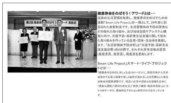
健康寿命をのばそう!アワードとは... 国民の生活習慣を改善し、健康寿命をのばすための運動「Smart Life Project」の一環として、24年度に創設された表彰制度です。生活習慣病の予防の啓発などの優れた取り組み、及び地域包括ケアシステム構築に向け、介護予防・高齢者生活支援に貢献した取り組みを行っている企業・団体・自治体を表彰します。「生活習慣病予防分野」と「介護予防・高齢者生活支援分野」の2分野で、それぞれ厚生労働大臣賞(最優秀賞、優秀賞)、局長賞を表彰します。