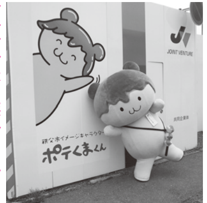
工事の仮囲いに貼付したポテくまくんのイラスト

申・固 9月7日(月)〜25日(金)までに 所定の申込書に必要書類を添えて 管財課(☎2212208)へ