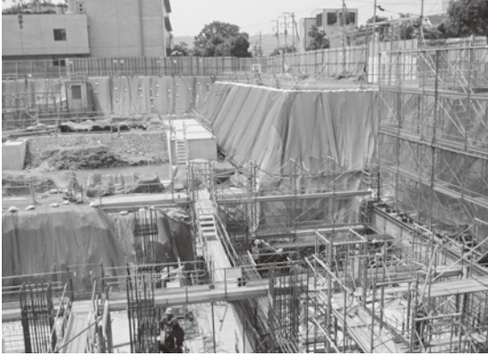
7月27日現在工事現場の様子