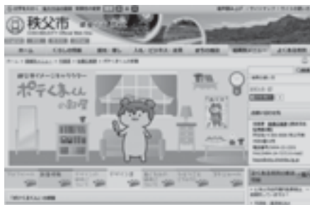
「ポテくまの部屋」で検索!