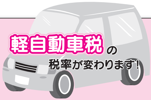
軽自動車税の税率経年変化表